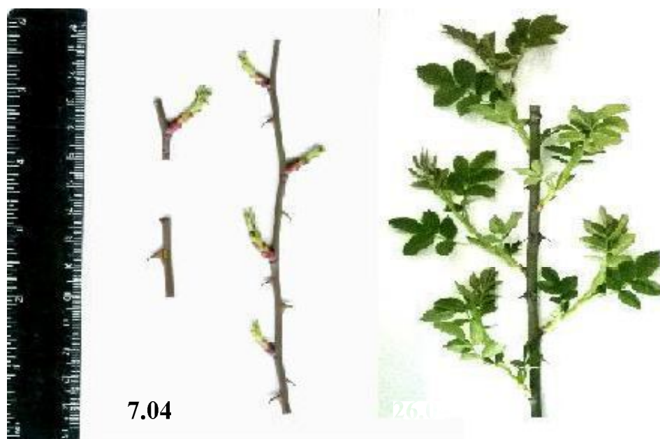
Рисунок 3. Замеры побегов и определение шиповатости у R. cinnamomea (весна 2016 г.)

Хорошо представлена корнеотпрысковость у R. beggeriana . У R. canina соотношение между корнями и стеблями наиболее уравновешенно. Этот вид дает мало отводков и почти не дает корневых отпрысков, или дает их мало и они весьма коротки. У R. spinosissima четко выделяются парциальные кусты, т.е. группы тесно расположенных надземных осей, в числе от 3 - 5 до 10 - 15 (вместе с подсохшими). В общей системе куста или куртины насчитывается до 50 парциальных кустов. В пределах каждого парциального куста оказываются побеги 3 - 4 порядков [5].