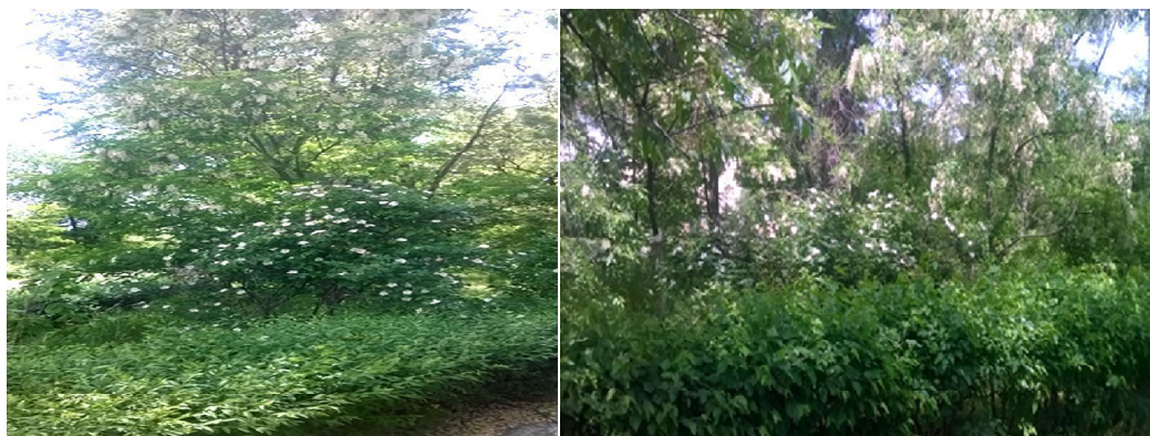
Рисунок 5. Сочетание R. canina с Ligustrum vulgare и Robinia pseudoacacia в озеленительных насаждениях

- низкорослые виды шиповников ( R. ecae , R. rugosa , R. spinosissima ) целесообразно использовать в садово-парковых группах и бордюрах, окаймляющих площадки, газоны, дорожки, цветники; среднерослые шиповники ( R. pomifera , R. acicularis ) рекомендуются для групповых посадок и в живые изгороди для выполнения декоративной и ограждающей функций, для ремизных насаждений; высокорослые шиповники ( R. canina , R. beggeriana ) можно использовать в качестве солитера, как акцент ландшафтной композиции, садово-парковых групп, массивов и свободно растущих или формованных живых изгородей, также они оптимальны для аллей по обеим сторонам пешеходных дорог, высоких живых изгородей, групповых и одиночных посадок (рисунок 5) [6,7].